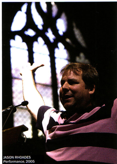
JASON RHOADES Performance, 2005

Den Abschluss bildete der Kunsthistoriker Wieland Schmied, der die Verdienste des Verstorbenen im kunsthistorischen Kontext aufzeigte. Höhepunkt blieb jedoch Jason Rhoades' Performance. Er kam nach vorne, breitete seine Arme aus und predigte seine Assoziationen.