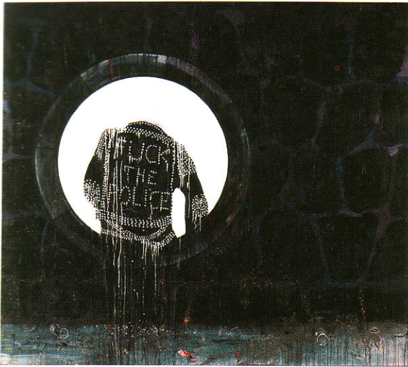
Lonely Old Slogan, 2006 Öl auf Leinwand 250 x 280,1 x 4,5 cm Leihgeber: Sammlung Falckenberg, Hamburg, © Sammlung Falckenberg, Hamburg

»Das Missverständnis« (2003). Während die frühen Figurationen sich häufig auf ein politisches Ereignis, also einen Zeitpunkt bezogen, wird hier versucht, eine Art Gleichnis zu formulieren: Die Menschen glauben, dass die Vögel den Zorn Gottes repräsentieren, und gehen als Vögel verkleidet in die Wälder, um sie zu beschwichtigen. Dabei wollen die geflügelten Geschöpfe den Bürgern der Stadt nur einen guten Rat geben. Richter kommt auf seiner Wahrheitssuche beinahe zwangsläufig immer wieder auf das Elend zurück. Das lässt sich in gegenständlicher Malerei viel präziser fassen und ist am stärksten in den Rücken-Ansichten verdichtet. »... es gibt eigentlich nichts Tragischeres, als mit dem Kopf zur Wand zu stehen und kein Loch mehr zu haben, in das man kriechen kann«, fasst Richter deren Grundstimmung zusammen. »Leben ist weit häufiger scheitern als gelingen, fürchte ich«, sagt einer, der nicht gescheitert ist. JULIA MUMMENHOFF