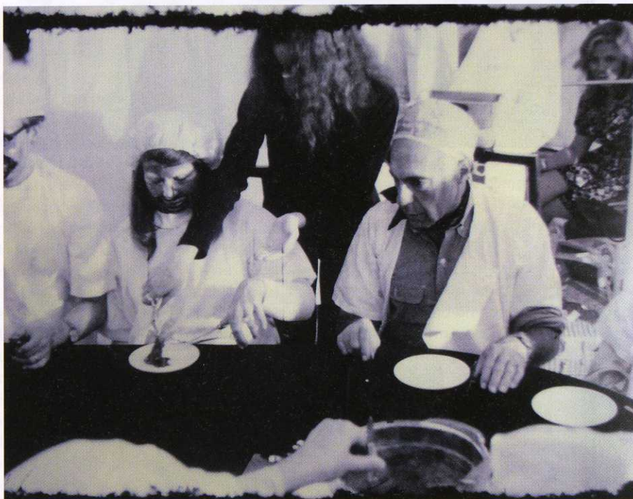
Fotografie von/ photograph of Ritual Meal , 1969