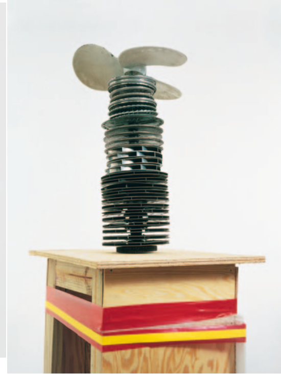
Fuck the Bauhaus, 2000 diverse Materialien / mixed media 193 x 70 x 50 cm

ähnliche Stahlrahmen montiert waren. Wie zwei Arkaden überspannte »ABC« eine Fußgängerpassage neben der Universitätsbibliothek und sah aus, als wäre sie Teil eines zukünftigen Neubaus, der aus unbekanntem Gründen nicht realisiert wurde. Baulich und ästhetisch verband sich »ABC« mit der Universitätsbibliothek, gleichzeitig fragilisierte sie diese Verbindung auf konstruktiver Ebene: Zwei der drei Pfeiler endeten wenige Zentimeter über dem Boden und waren folglich nicht tragend. 3 Somit ruhte das gesamte Gewicht der Betonkonstruktion auf einer einzigen Stütze und den Mauern der Bibliothek. Äußerlich stellte sich »ABC« in die Tradition der abstrakten modernistischen Skulptur und des International Style, führte jedoch deren Forderung der Funktionalität ad absurdum. Dasselbe wiederholte »ABC« auch in Bezug auf sich damals etablierende neue Diskurse zur Kunst im öffentlichen Raum, die »Skulptur Projekte in Münster« nicht nur maßgeblich prägten, sondern dort auch weiterentwickelt wurden. Die »Ausstellung« führte nicht nur unterschiedlichste Möglichkeiten der künstlerischen Interventionen vor, sondern sie setzte auch die weit verbreitete Forderung um, dass Kunst im urbanen Raum nicht dekorieren, sondern gesellschaftliche und städtebauliche Funktionen erfüllen sollte. Auch in dieser Hinsicht war »ABC« ein Affront.