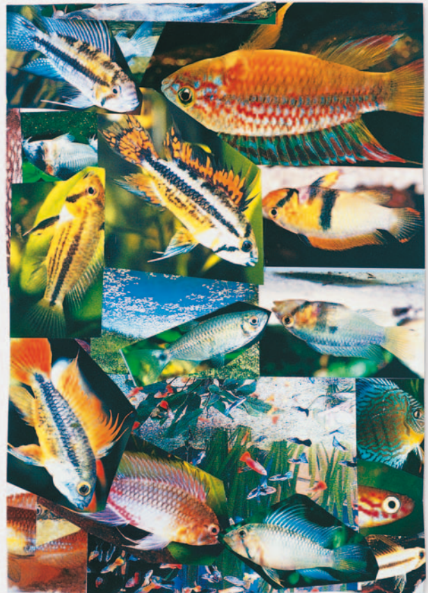
Fischcollage, 2001 Collage 29 x 21 cm