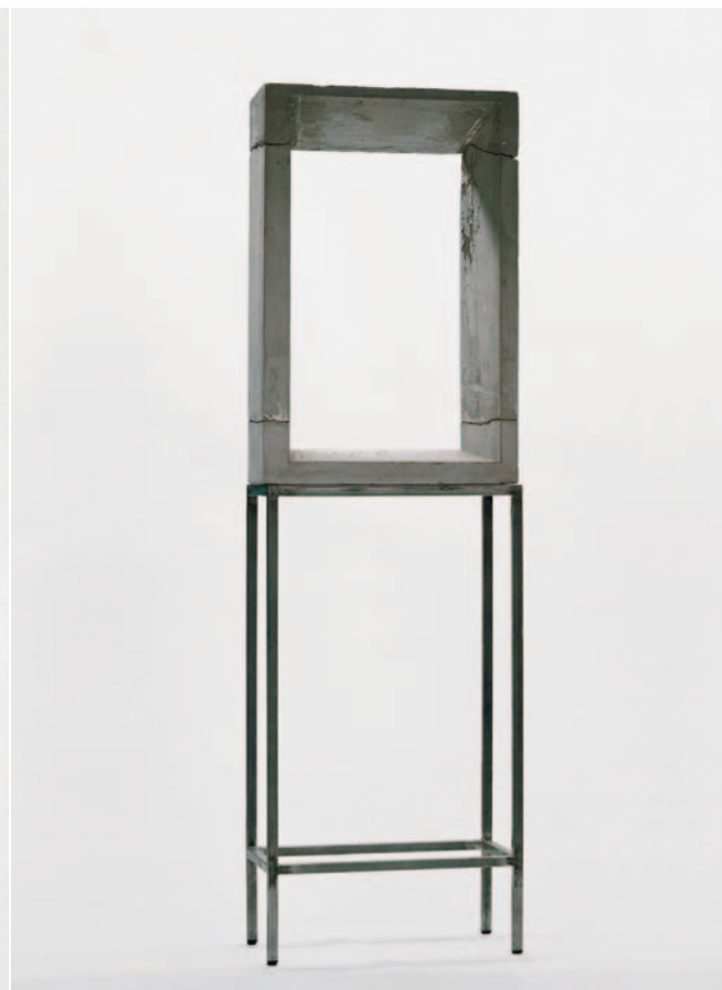
Fenster, 1990 Beton, Stahl / concrete, steel 257,5 x 77 x 38 cm