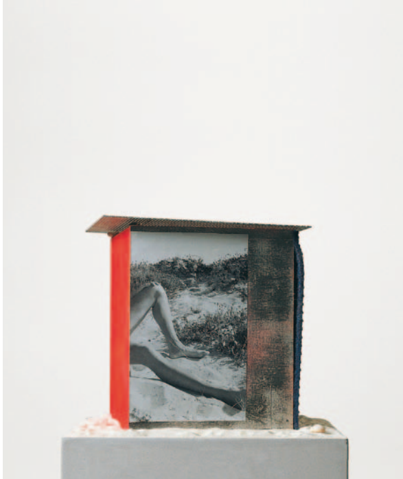
Strandhäuser zum Umziehen, 2000 Holz, Papier, Muscheln, Sand, Aluminium / wood, paper, shells, sand, aluminium 178 x 34 x 35 cm