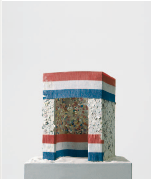
Strandhäuser zum Umziehen, 2000 Ölackpapier, Holz, Konfetti / lacquered paper, wood, confetti 173 x 29 x 35 cm