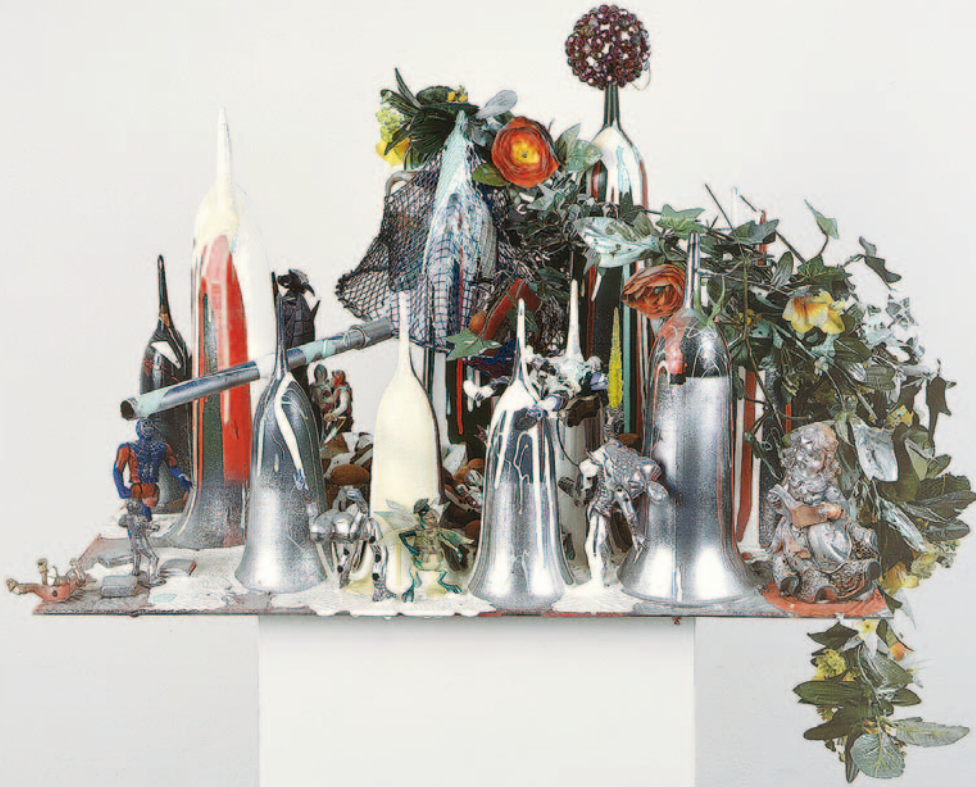
Empire Vampire III, 3, 2004 Kunststoff, Lack, Metall, Stoff, Samen, Holz / plastic, laquer, metal, fabric, seeds, wood 180 x 70 x 45 cm