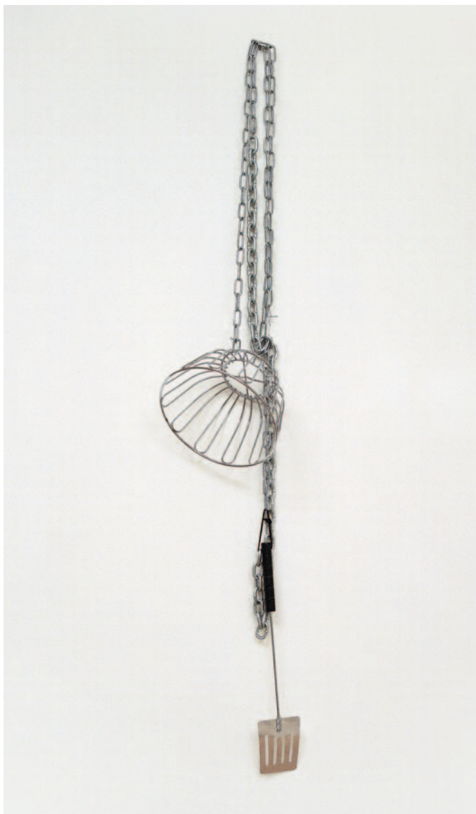
Schwules Baby, 1997 Metall, Kunststoff / metal, plastic 122 x 25 x 20 cm