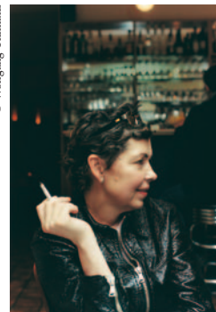
ISA GENZKEN 1948 in Bad Oldesloe, Deutschland, geboren. Studium an der Hochschule für bildende Künste, Hamburg, der Hochschule der Künste, Berlin, der Universität Köln und der Staatlichen Kunstakademie Düsseldorf. Lebt und arbeitet in Berlin. / Born in 1948 in Bad Oldesloe, Germany. Studied at the University of Fine Arts, Hamburg, the Berlin University of the Arts, the University of Cologne and the Düsseldorf State Art Academy. Lives and works in Berlin.