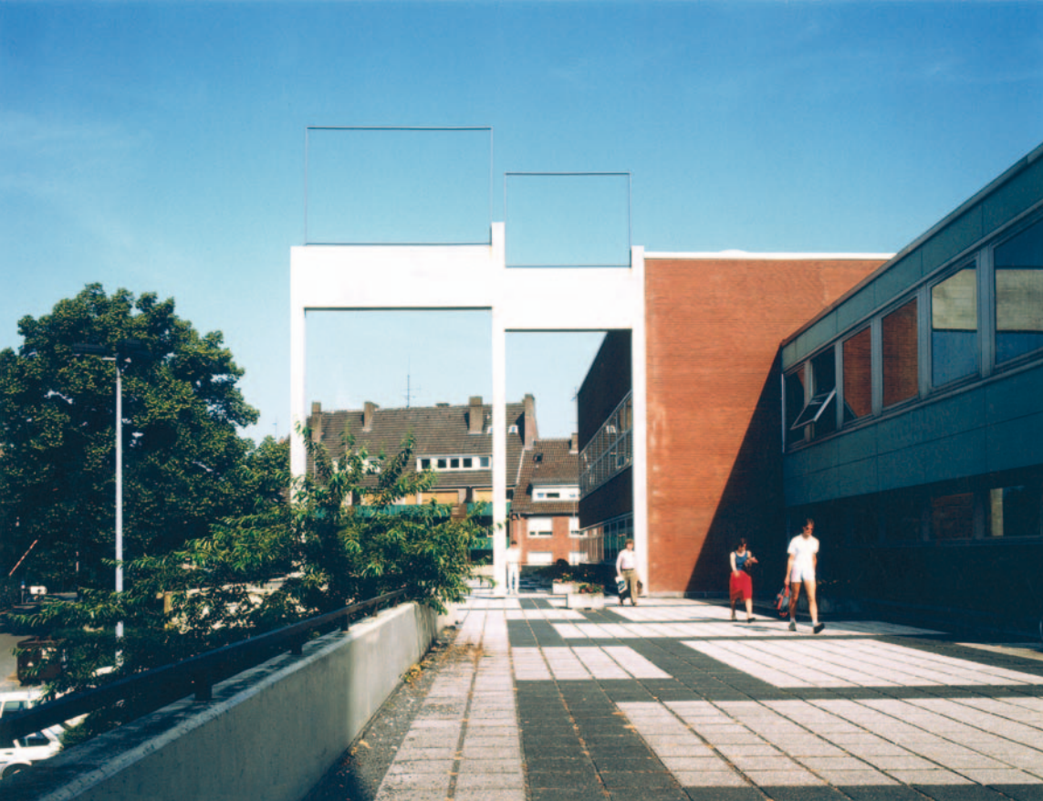
ABC, 1987 Beton, Stahl / concrete, steel 1485 x 1120 x 40 cm Installation Skulptur Projekte Münster 1987